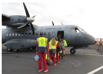
Départ de la délégation

Face à la détresse rencontrée, beaucoup de membres de l'équipe auraient aimé faire davantage et plus longtemps mais ils ont tout de même la satisfaction d'avoir rempli leur mission qui était de contribuer à sortir d'une situation d'urgence pour arriver à une stabilité propice à une reconstruction. Au-delà de l'intervention, la présidence des accords FRANZ à compter de l'été 2015 par la France sera l'occasion d'effectuer un retour d'expérience du déploiement au Vanuatu lors d'une réunion des partenaires qui se déroulera en Polynésie française.