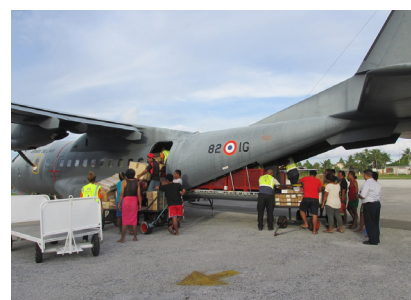
Déchargement du matériel du CASA