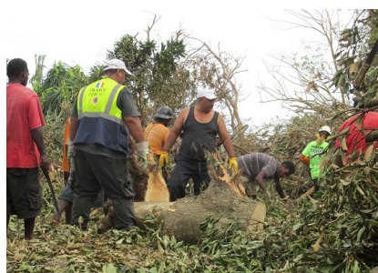
Dégagement des routes