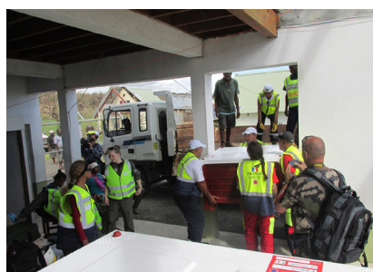
Déchargement du matériel