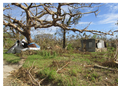
Après le passage du cyclone PAM